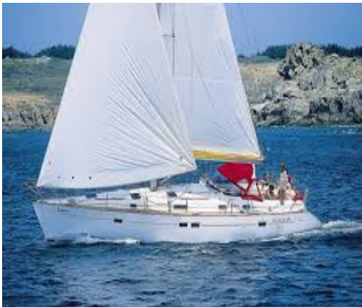
Oceanis 411 (hasta 6 tripulantes)